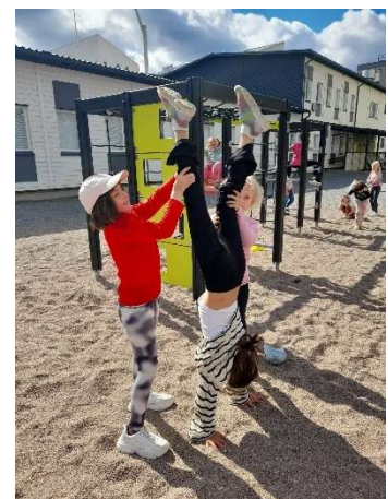
Kuva 3 Iltapäivätoiminnan ulkoilua

Toimintaa on ohjannut iltapäivätoiminnan päällikkö ja kaksi iltapäivätoiminnan koordinaattoria. Iltapäivätoiminnan päällikkö on toiminut esihenkilönä kaikille iltapäivätoiminnassa työskenteleville.