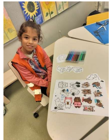
Kuva 2 Lupa harrastaa askarteluryhmästä

Ryhmä on kokoontunut kerran viikossa tunnin ajan ja osallistujia on ollut yhteensä 14.