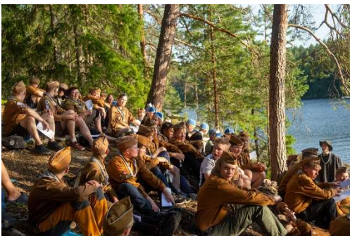
Kuva 6 Kotkien kesäleiri

Kotkilla on myös vankka kisaperinne. Eri järjestöjen partiotaitokisoissa käytiin ympäri vuoden. Kotkilla oli myös sisarlippukunta Lokkien kanssa yhteinen yön yli kestävä pyöräilykisa Yö-ralli. Lisäksi järjestettiin muutaman vuoden tauon jälkeen syksyinen partiotaitokisa Kohme syysreissun yhteydessä.