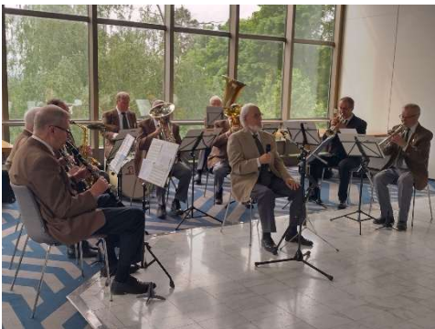
Kuva 5 Sotainvalidien Veljesliiton Pirkka-Hämeen piirin kesäjuhla 11.6.2025 Hotelli Rosendahlissa

Tampereen Kotkien Weteraanisoittajien 50 vuotta kestänyt aktiivinen soittotoiminta on mieleenpainuvine kokemuksineen ja muistoineen takanapäin. Soittotoimintaa voimme jatkaa epävirallisesti pienemmissä soittopiireissä. Haluamme esittää lämpimät kiitokset kaikille soittajille.