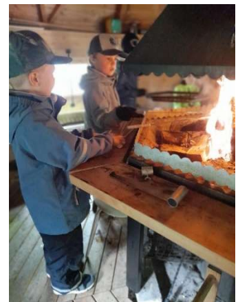
Kuva 4: Kesän päiväleirin retkipäivä

Toiminnan rahoitus on koostunut Aluehallintoviraston avustuksesta sekä osallistumismaksusta.